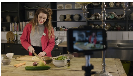
Enregistrez-vous avec le Memory Mic...

Le Memory Mic se connecte à l'application pour smartphone MEMORY MIC (disponible gratuitement sur Google Play ou Apple Store) par Bluetooth et fonctionne sans aucun câble, pour donner à l'utilisateur une grande liberté de mouvement et donc de création dans la conception de ses vidéos. Il suffit ensuite de synchroniser l'audio et la vidéo via l'application en appuyant sur un simple bouton. L'application comprend en outre une fonction de mixage qui permet de sélectionner intuitivement un bon équilibre entre le son du Memory Mic et le son ambiant enregistré par le smartphone.